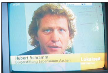
Hubert Schramm Bürgerstiftung Lebensraum Aachen

Dabei hilft ihr auch ein Stipendium, sie bekommt 100 Euro pro Monat. Die Aachener Bürgerstiftung zahlt davon 50 Euro. Die anderen 50 Euro kommen aus dem Topf des landesweiten Förderprogramms "Start", eine Initiative von Unternehmen und Bildungsministerium. Von diesem Geld kauft sie Bücher und Schulmaterial. Extra-Ausgaben, wie Klassenfahrten, bekommt sie zusätzlich finanziert. Genauso wie einen Laptop, gestiftet von den Aachener Bürgern.