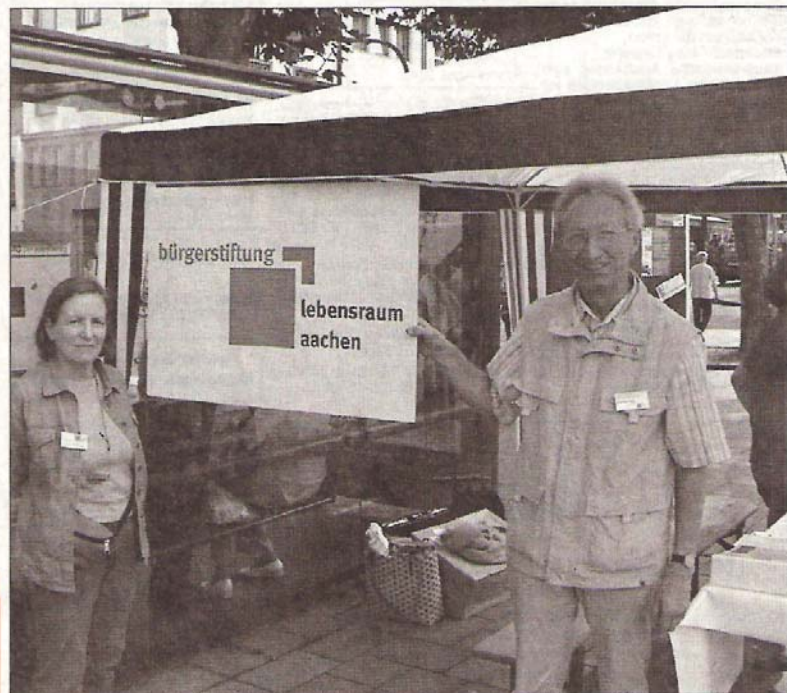
Agenda-Markt in Aachen - die Bürgerstiftung Lebensraum Aachen war dabei.