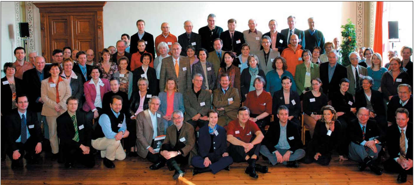
Die Arbeitsgruppe der Deutschen Bürgerstiftungen oder die „Bürgerstiftungsfamilie“