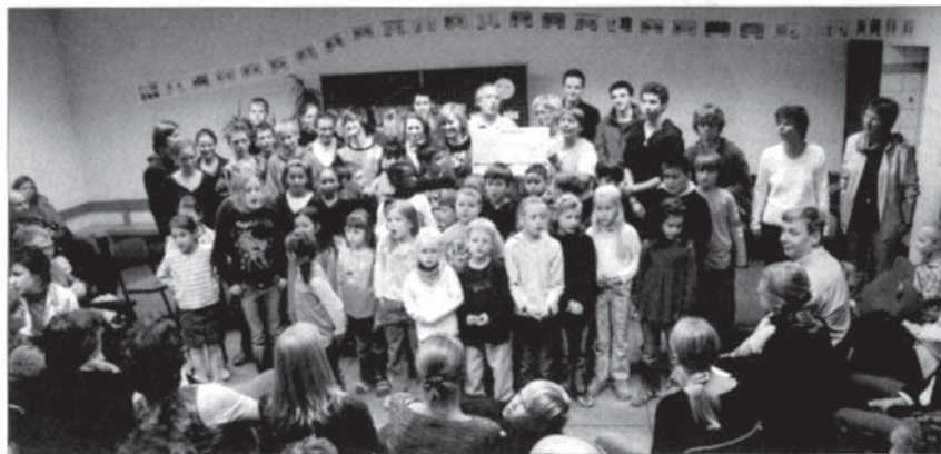
Haben ein ganz besonderes Verhältnis entwickelt: Schüler des Pius-Gymnasiums helfen den Grundschulern in der Passstraße nachmittags bei den Hausaufgaben und beim Lernen.