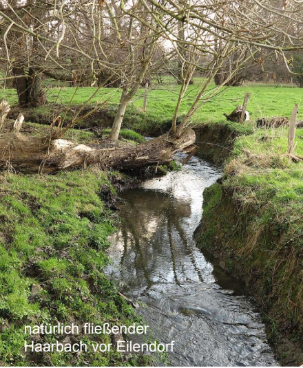
natürlich fließender Haarbach vor Eilendorf