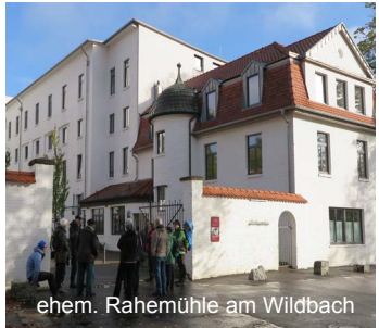
ehem. Rahemühle am Wildbach