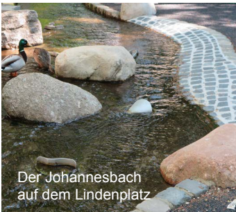
Der Johannesbach auf dem Lindenplatz