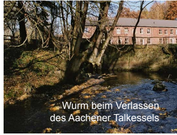
Wurm beim Verlassen des Aachener Talkessels