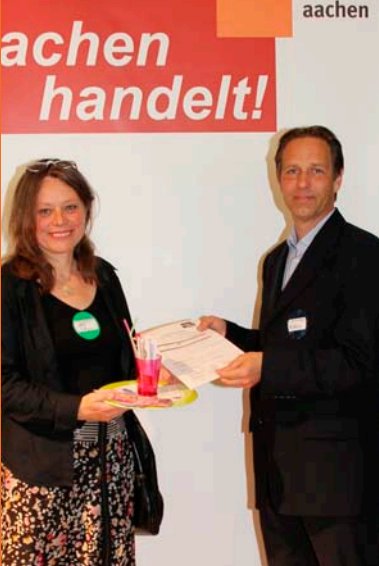
Germax Media GmbH Frauennotruf Aachen