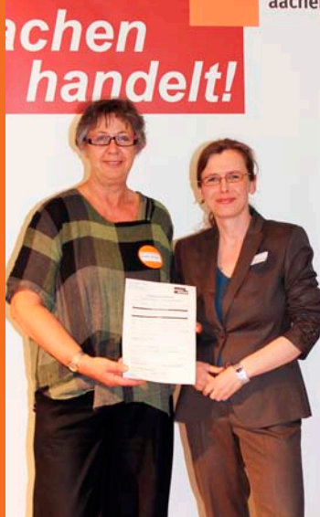
XIQIT GmbH Freiwilligenzentrum/Caritas