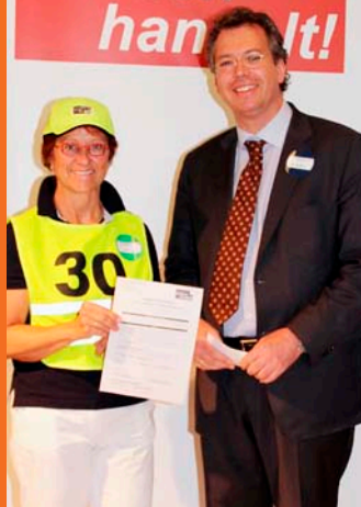
Oellers-Immex GmbH Verkehrswacht Aachen