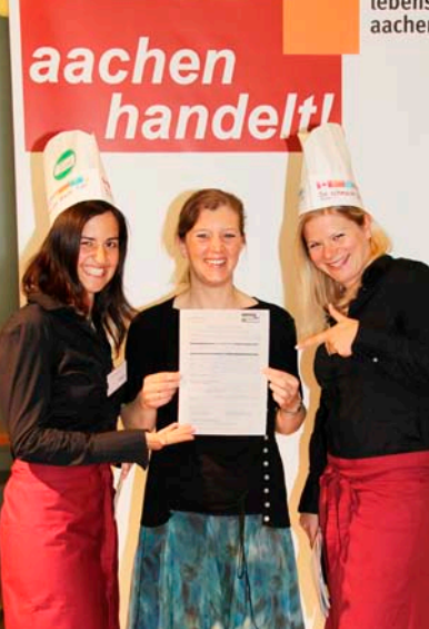
averto gmbh Sozialwerk Aachener Christen