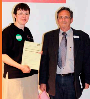
MYPEGASUS GmbH Armen-Schwestern/ Franziska Schervier

Bürgerstiftung lebensr aachen aachen handelt!