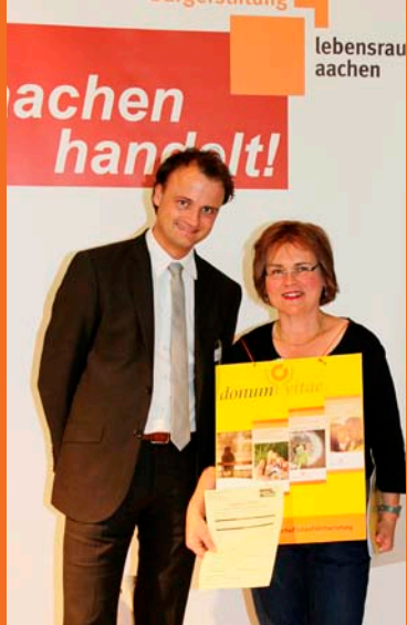
i2 solution Donum Vitae Aachen