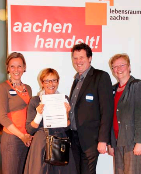
ac.consult Lebenshilfe Aachen