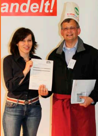
averto GmbH Sozialwerk Aachener Christen