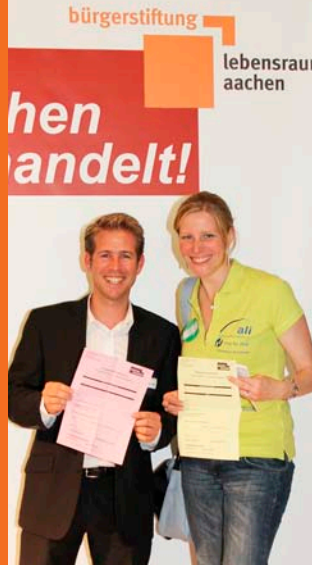
Jäschke Immobilien Aachener Laienhelfer Initiative