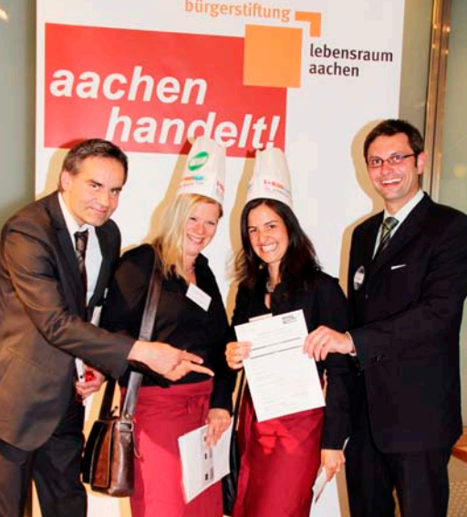
AIXLAW Rechtsanwälte Sozialwerk Aachener Christen