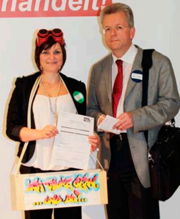
Bergmoser + Höller Verlag Suchthilfe Aachen