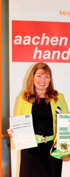
Mohné GmbH AWO