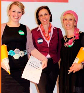
Biron & Jansen GmbH Weltladen

Bürgerstiftung leben aachen aachen handelt!