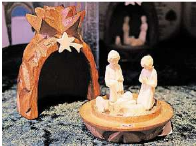
Krippenausstellung bei Missio: „Von Kolumbien nach Aachen“, 175 Krippen-Szenen sind zu sehen von 10 bis 18 Uhr bei „Weltweit am Dom“ am Münsterplatz 28.