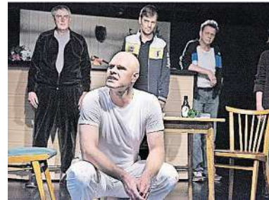
„Nationalstraße“ im Mörgens: Heute wird das Stück von Jaroslav Rudis um 20 Uhr im Mörgens an der Mörgensstraße 24 aufgeführt.

Notdienste der Kassenärztlichen Vereinigung Nordrhein (für Kassen- und Privatpatienten) : Arztzentrale : inklusive Hals-Nasen-Ohrenärztlichem und Augenärztlichem Notdienst: 19 bis 7 Uhr, Tel. 116 117 (gebührenfrei).